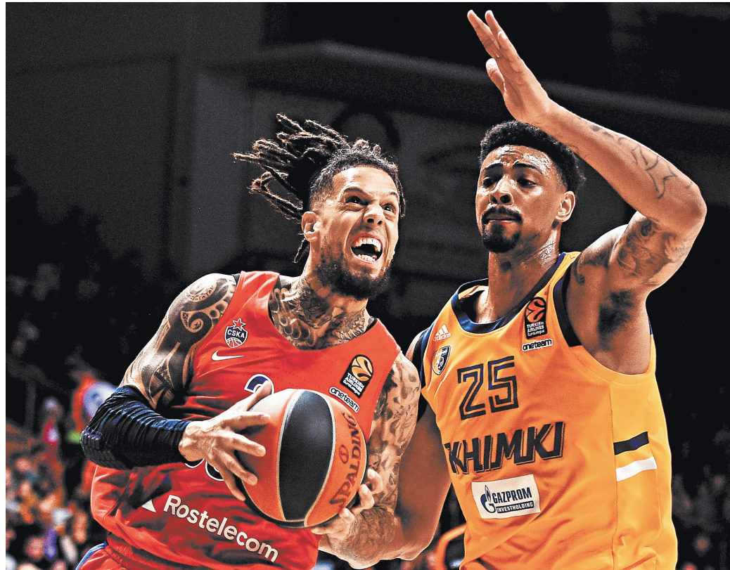
Баскетболисты ЦСКА (слева) обыграли в Евролиге «Химки» (80:72) и обеспечили себе второе место в таблице.