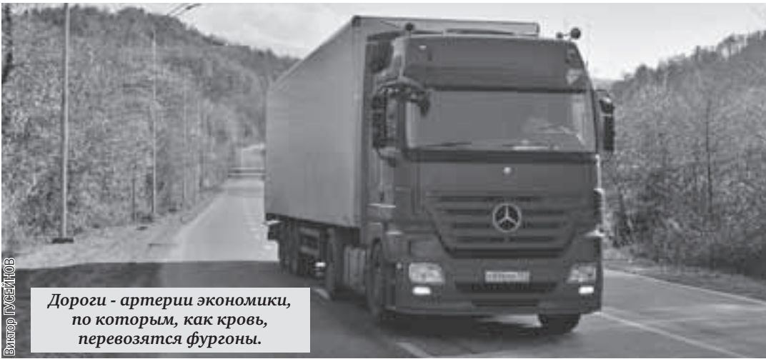
Дороги - артерии экономики, по которым, как кровь, перевозятся фуры.