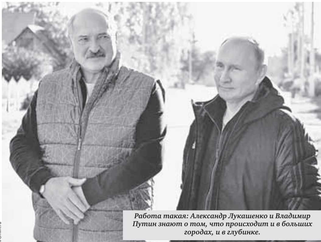
Работа такая: Александр Лукашенко и Владимир Путин знают о том, что происходит и в больших городах, и в глубинке.