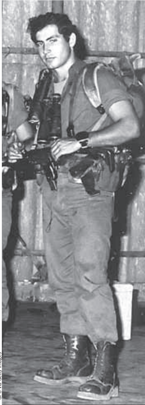
Будущий премьер в 1973 году - во времена службы в спецназе.

однопартийцы Нетаньяху требовали его отставки. За невиданный провал нес ответственность премьер. Но расследовать причины отказался.