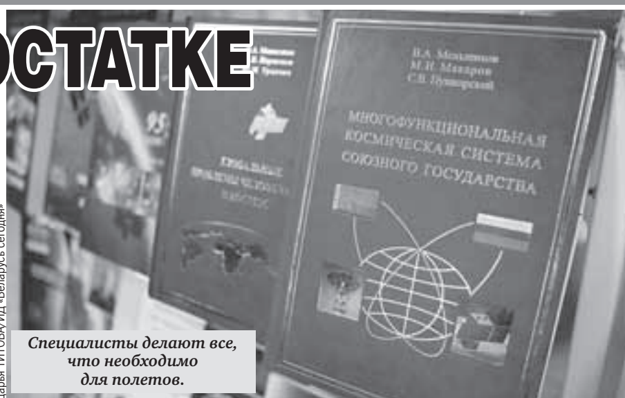
Специалисты делают все, что необходимо для полетов.