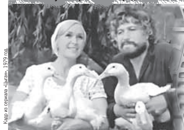
Кадр из фильма «Цыганы», 1979 год.