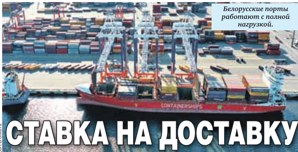
Белорусские порты работают с полной нагрузкой.

Пока петербургские гавани вне конкуренции: расстояние до Беларуси - рукой подать, налажена железнодорожная инфраструктура. В 2023 году через все российские порты перевезли 14,1 миллиона тонн белорусских грузов, из них 12,9 миллиона - через Северный край.