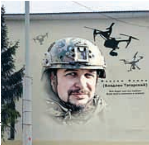
Художник отметил, что на создание работы ушло десять часов.

В этом году военному корреспонденту исполнилось бы 43 года. Он родом из донецкой Макеевки. По окончании школы работал на шахте. В