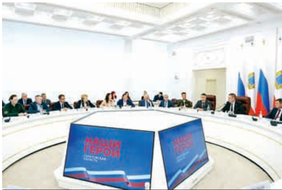
На программу профессиональной переподготовки уже зачислены 50 участников и ветеранов СВО.

Наши дети, мужья и отцы не просто возвращаются с фронта, они переводят свою боевую закалку в мирное русло. И важно понимать, что человек, прошедший СВО, - это не «бывший военный», а специалист с железной волей, которому можно доверить самые сложные задачи, - выразила свои впечатления от инициативы жена