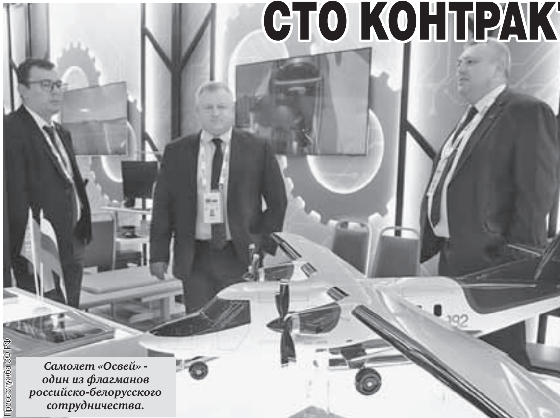
Самолет «Освей» - один из флагманов российско-белорусского сотрудничества.