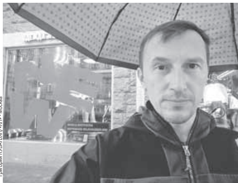
Гуляя по центру Петербурга, я засомневался: то ли дождь идет, то ли это уже rain капает на мой umbrella...

ляется администратор. - К нам в основном приходят обедать. Нельзя же назвать столовую «Обеденное время»! Хотелось как-то оригинальнее.