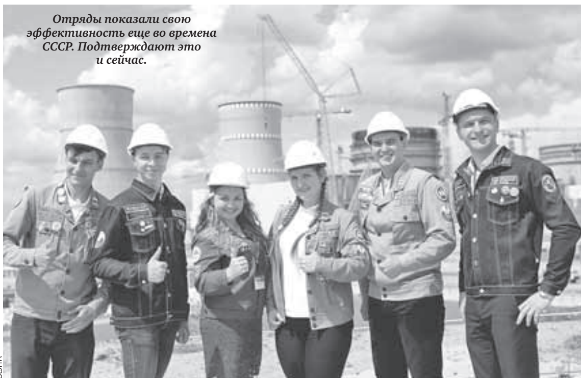
Отряды показали свою эффективность еще во времена СССР. Подтверждают это и сейчас.

Прокачивать педагогические способности ребята