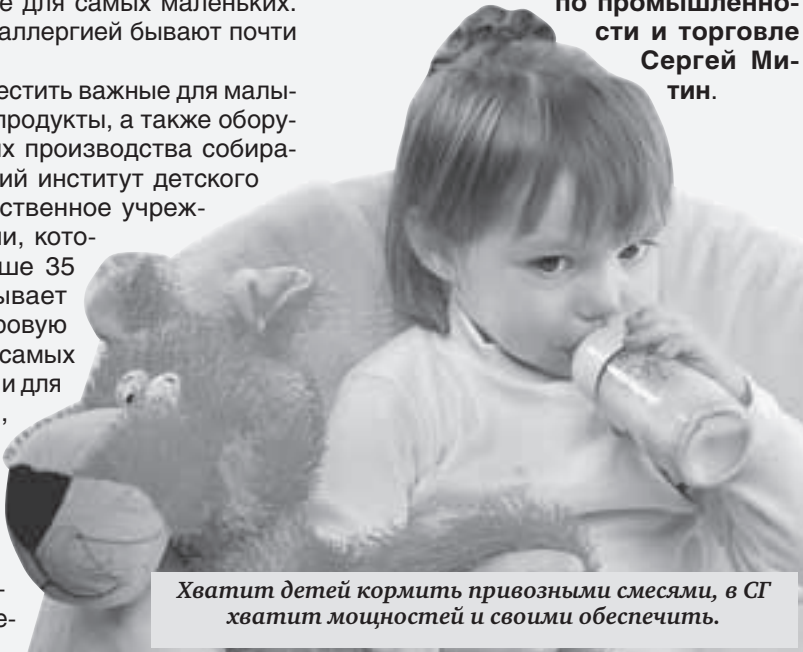
Хватит детей кормить привозными смесями, в СГ хватит мощностей и своими обеспечить.