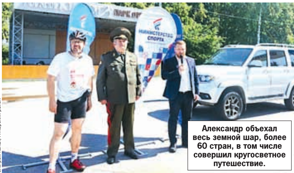
Александр объехал весь земной шар, более 60 стран, в том числе совершил кругосветное путешествие.