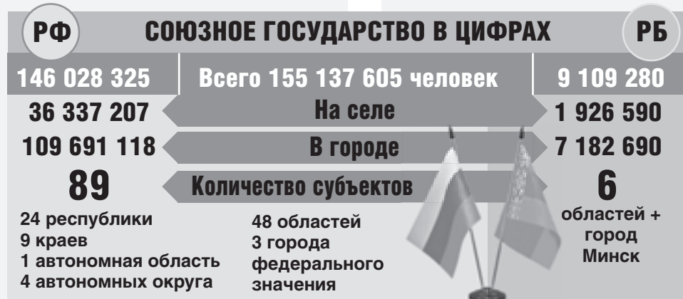
По данным на 1 января 2025 года органов статистики РФ и РБ.

✓ Принципиальное требование, которое задает тон работе на предстоящую пятилетку, - набрать такую мощь, чтобы хватило заряда на долгую дистанцию. Еще одним важным тезисом является установка на выравнивание качества жизни граждан, где бы они ни жили: в деревнях, агрогородках, районных центрах - везде условия должны быть как в столице. Именно сильные регионы являются источником процветания страны, ее безопасности, народного единства.