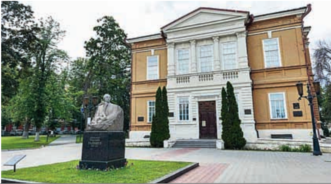
В коллекции музея десятки тысяч экспонатов, которые отражают разные эпохи, художественные стили и направления.

Саратовский государственный художественный музей имени А.Н. Радищева - один из крупнейших культурных центров России: десять площадок в столице региона и области, более 37 000 экспонатов, проекты по всей стране.