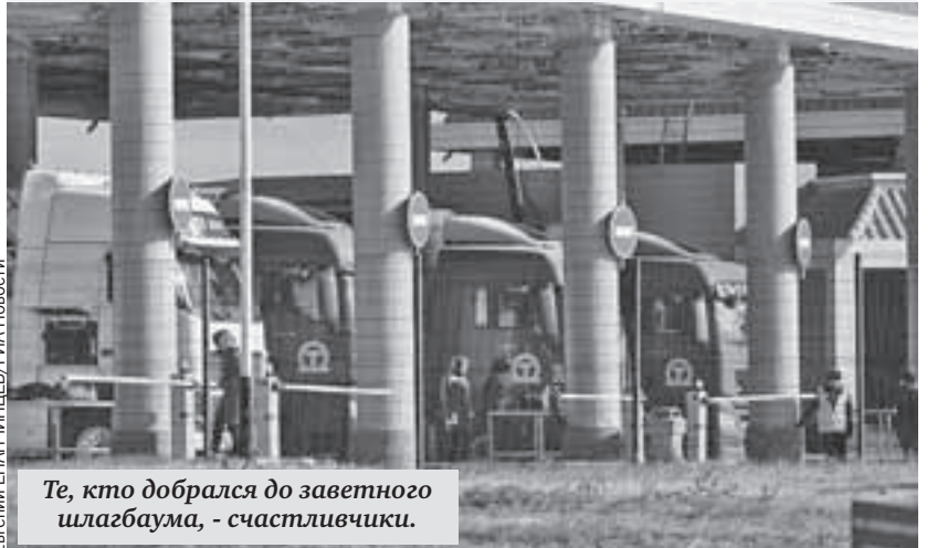
Те, кто добрался до заветного шлагбаума, - счастливичики.