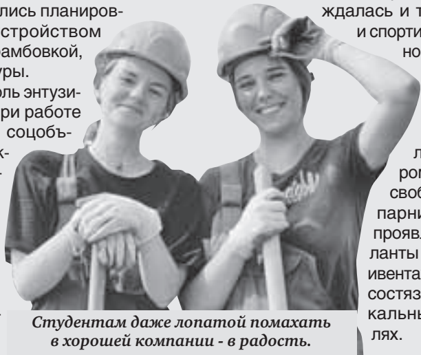
Студентам даже лопатой помахать в хорошей компании - в радость.

Не одну мозоль энтузиасты набили при работе на различных объектах. Ведь буквально за несколько лет в Островце выросли многоэтажки, магазины, детские сады, спортивные комплексы, больница.