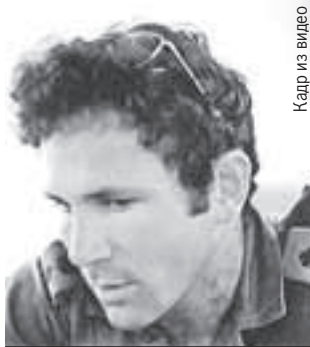
Брат Нетаньяху Йони погиб, освобождая заложников.

А вот его старший брат Йонатан погиб в 1976-м, освобождая заложников с рейса Air France, который летел в Париж из Тель-Авива. Палестинские и солидарные с ними немецкие террористы, члены «Революционных ячеек», вынудили экипаж сесть в Уганде. 30-летний полковник Йони командовал операцией и получил пулю в горло. «Это изменило смысл моей жизни», - признавался Нетаньяху.