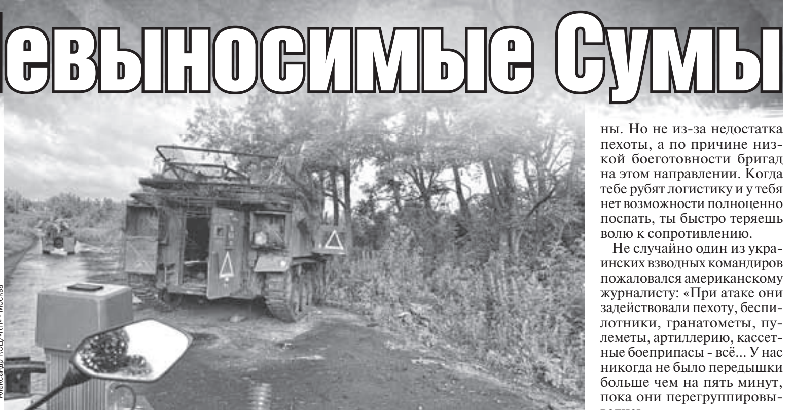
Дорога на Сумы заставлена брошенной техникой ВСУ. Как вот этот натовский бронетранспортер с треугольником на борту - знаком войск, вторгавшихся на Курщину.

Так вот в чем был смысл этого беспримерного похода! Зайти на территорию России, чтобы подготовиться к обороне на своей земле? Загадочная тактика, которая, впрочем, не принесла ожидаемых плодов. Окопы у ВСУ, пишет Wall Street Journal, если и есть, то устаревшие и не защищают от дронов. А на некоторых участках приходится рыть траншеи прямо под огнем. При этом опасные участки прорыва российских войск даже не были заминированы.