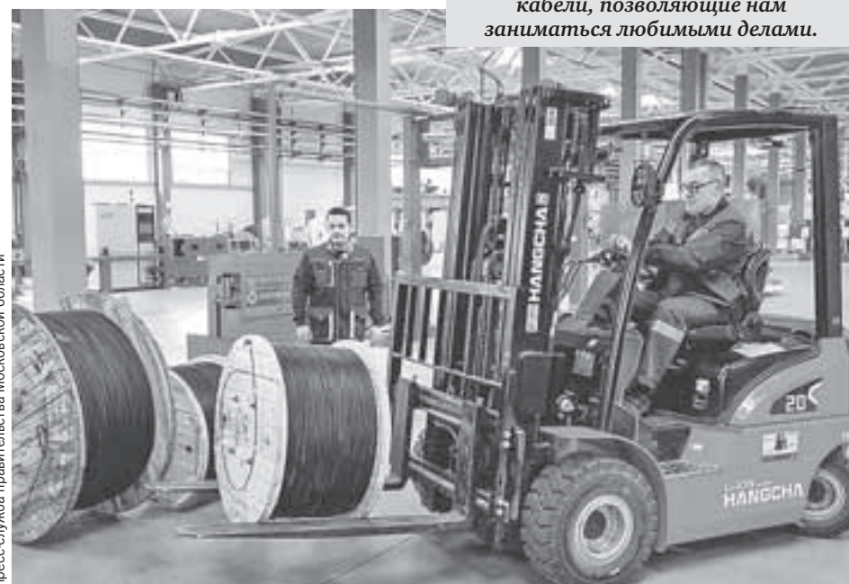
Когда пользуемся интернетом или смотрим ТВ, не задумываемся, насколько важны различные кабели, позволяющие нам заниматься любимыми делами.

- Такой замечательный проект был реализован в годовщину Великой Победы. Это еще одно подтверждение того, что мы строим Союзное государство. И того, что в технологическом смысле становимся сильнее, что все можем. И, несмотря на уход иностранных компаний, развиваемся и двигаемся вперед. С введением этого производства в строй мы еще на один шаг стали более импорто-независимыми. Рад, что этот проект