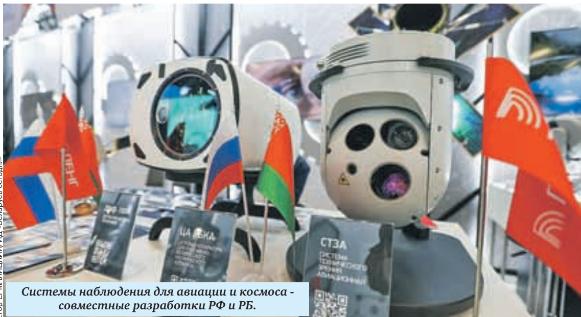
Системы наблюдения для авиации и космоса - совместные разработки РФ и РБ.

Одна из главных целей единой системы мер поддержки семьи и детей в России - по-