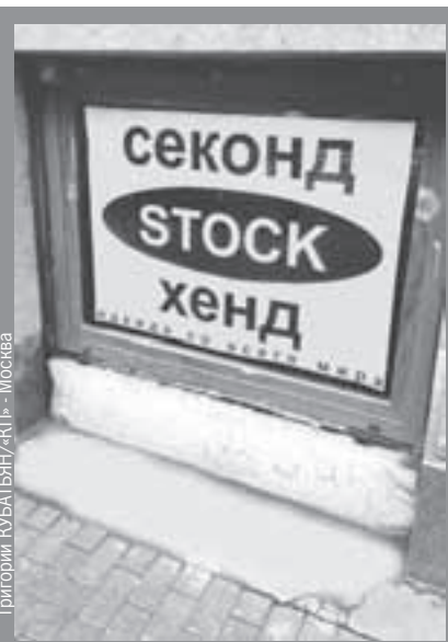
Петербург тонет в англицизмах, как старый фрегат. Скоро почти все вывески переведут на русский, либо хотя бы напишут кириллицей. Но будет ли это красиво?..