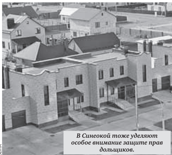
В Синеокой тоже уделяют особое внимание защите прав дольщиков.

- Мне давали сигнал застройщики о том, что они охотно сегодня работают с белорусскими подрядчиками, - говорит Сергей Пахомов. - Мы их горячо приветствуем. Белорусские компании сегодня все увереннее приходят на наш рынок, предлагая более интересные условия, чем зачастую даже наши строители. Это хорошая внутренняя конкуренция.