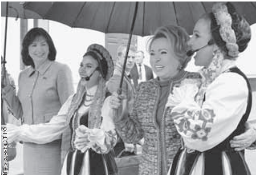
Валентина Матвиенко и Наталья Кочанова с удовольствием реагировали на песни фольклорных коллективов. И даже дождь не в силах был помешать празднику регионов.