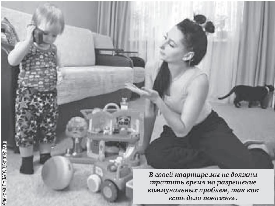
В своей квартире мы не должны тратить время на разрешение коммунальных проблем, так как есть дела поважнее.